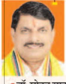
डॉ. मोहन यादव