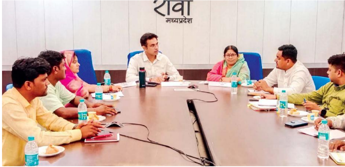
फतवा समाचार ❖ रीवा

मुख्यमंत्री शिवराज सिंह चौहान ने सिंगल क्लिक के माध्यम से मुख्यमंत्री जन कल्याण (संबल) योजना के अंतर्गत प्रदेश के 26150 श्रमिकों को 583 करोड़ों रुपये की राशि का अंतरण किया। इस योजना से रीवा जिले के 750 हितग्राहियों को भी लाभ मिला।