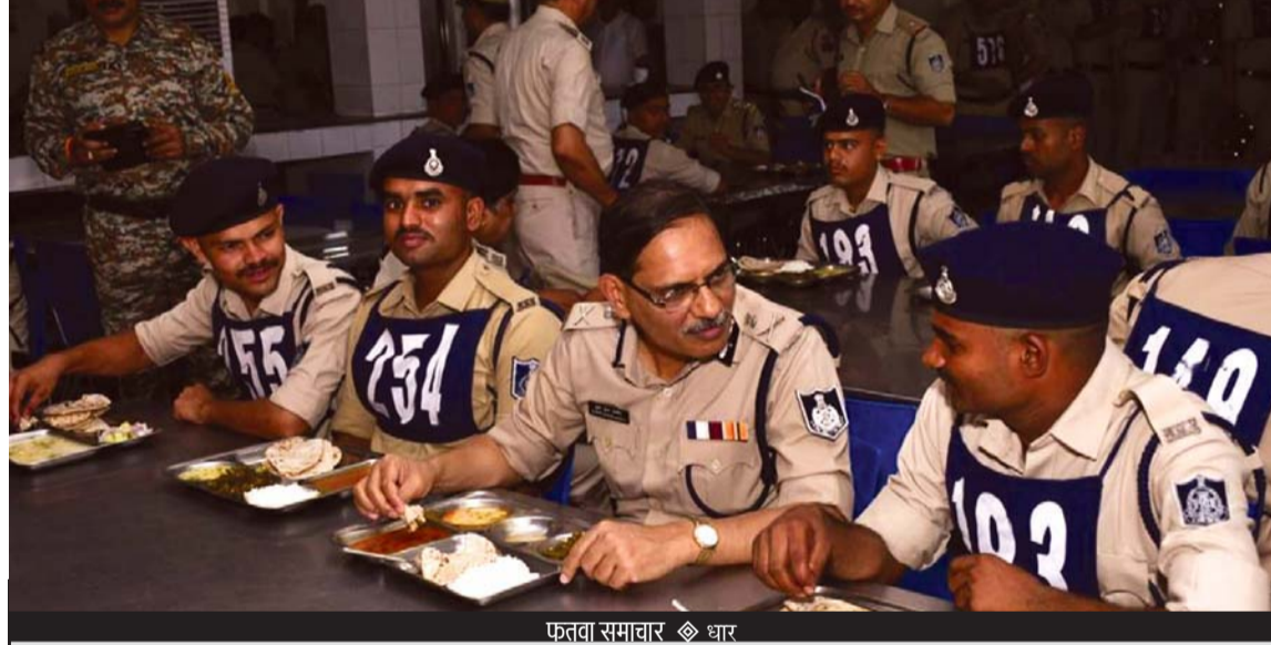
फतवा समाचार धार