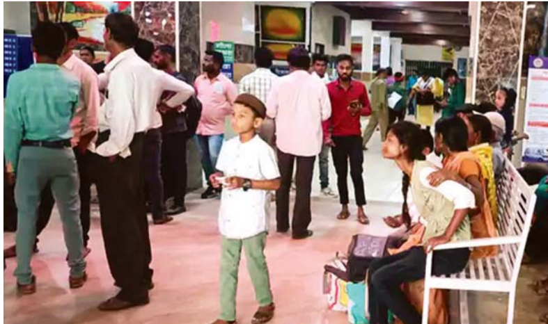
फतवा समाचार सिवनी

सिवनी जिले में कई खाद्य प्रतिष्ठान खराब क्वालिटी की सामग्री बना और बेच रहे हैं। जिसके कारण लोगों के स्वास्थ्य पर विपरीत प्रभाव पड़ रहा है। खाद्य सुरक्षा विभाग लगातार कार्रवाई कर रहा है लेकिन विलंब से सैंपल की रिपोर्ट आने के कारण खराब क्वालिटी की खाद्य सामग्री पर रोक नहीं लग रही। सिवनी जिले में प्रयोग किए जाने वाले मसाला, सोयाबीन, फल्लूदाना सहित अन्य खाद्य सामग्रियां पदार्थों के सैंपल लिए जा रहे