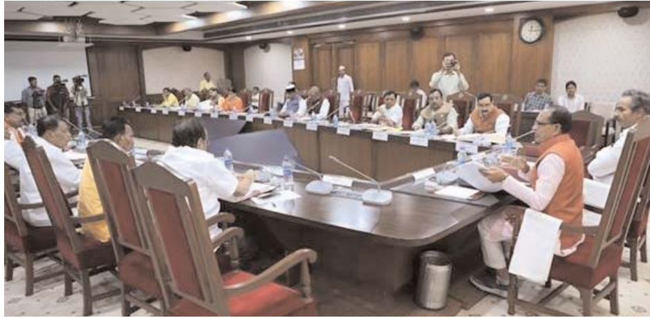
समेत 5479 करोड़ रुपए के कर्जदार हैं। सरकार द्वारा इन किसानों के इस कर्ज का ब्याज बैंकों में भर दिया जाएगा

खण्डवा, छतरपुर और देवास में नवीन अनुविभाग का सृजन मुख्यमंत्री चौहान की अध्यक्षता में मंत्रि-परिषद के निर्णय